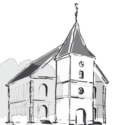
St. Martini Brelingen