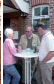
Fotoimpressionen vom Mitarbeiterfest in Mellendorf, Fotos:privat