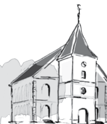
St. Martini Brelingen