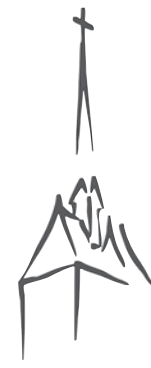
St. Georg Mellendorf