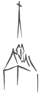
St. Georg Mellendorf