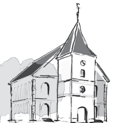
St. Martini Brelingen

Alle Termine in dieser Ausgabe nur unter Vorbehalt! Aktualisierungen bitte aus Presse, Internet und Schaukästen