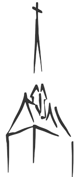
St. Georg Mellendorf