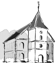
St. Martini Brelingen