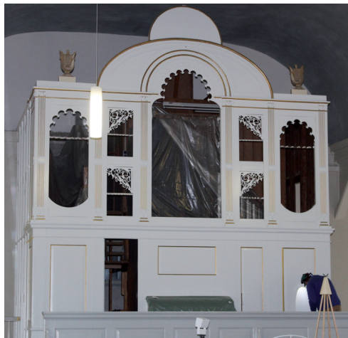
Die Ornamente im Orgelprospekt werden jetzt durch Goldstreifen betont. (Foto links)

Mit Blick auf das Kirchenjubiläum sind seit einem Jahr umfangreiche Renovierungs- und Sanierungsarbeiten im Inneren der Kirche vorgenommen worden. Wesentliche Maßnahme war die Sanierung der Tonnendecke. Insgesamt sind für Decke und Orgel rund 150.000 Euro investiert worden. Ein Großteil dieser Summe ist durch Spenden und Zuschüsse von verschiedenen Stiftungen und Organisationen aufgebracht worden. (FB)