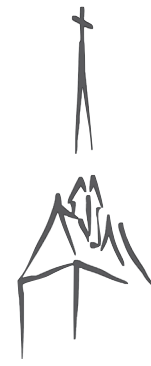
St. Georg Mellendorf