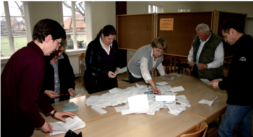
Auszählung der Stimmen in Brelingen bei der Kirchenvorstandswahl 2012

Der Kirchenvorstand hat sich in seiner Amtszeit der Visitation durch den Superintendenten gestellt, hat dazu beigetragen, dass ein Diakon für die Jugendarbeit eingestellt werden konnte und hat sich aktiv an der Betreuung von Kriegsflüchtlingen beteiligt. Die Organisation von gemeinsamen Mitarbeiterfesten und die Anlage und Eröffnung des Urnenhains auf dem Friedhof in Brelingen stehen außerdem in der Bilanz dieses Kirchenvorstandes. In den Kirchenvorstandssitzungen, die monatlich stattfinden, sind außerdem zahlreiche Beschlüsse erarbeitet und gefasst worden, die auf der kirchlichen Verwaltungsebene erforderlich waren.