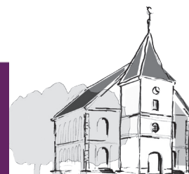
St. Martini Brelingen