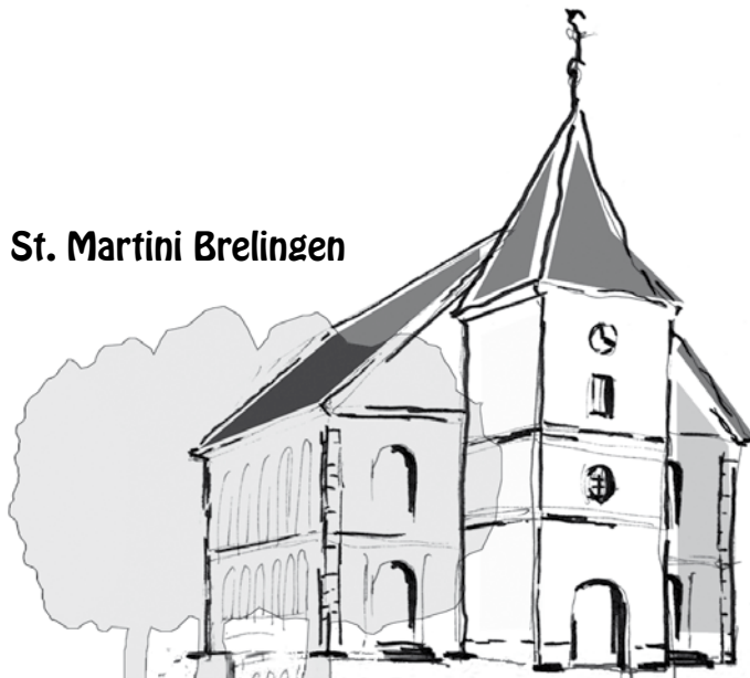
St. Martini Brelingen