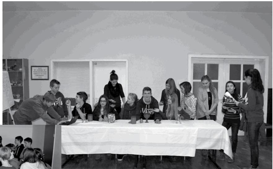
Bild oben: Die Konfirmandinnen und Konfirmanden stellen das letzte Abendmahl von Leonardo da Vinci nach.

Nach unserem geänderten Konfirmandenunterrichtsmodell beginnt der Konfirmandenunterricht erst im Januar. Entsprechend später liegt auch der Termin zur Anmeldung der neuen Konfirmanden, der rechtzeitig in den Glockentönen und in der Zeitung veröffentlicht wird.