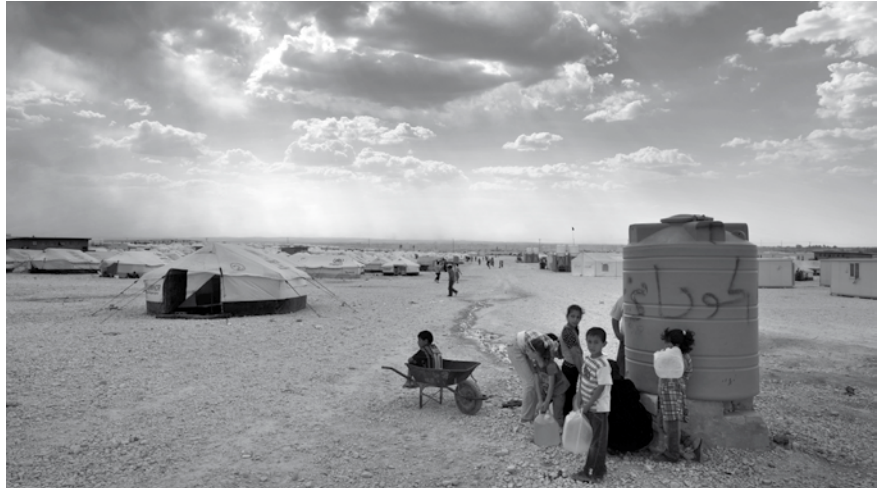
Eine der zahlreichen Wasserstellen im Za'atari refugee camp in Jordanien. Rund 3 Millionen Liter Trinkwasser müssen täglich in das Lager gebracht werden. Im Za'atari refugee camp, das nahe der syrischen Grenze liegt, leben zur Zeit fast 170.000 syrische Flüchtlinge.