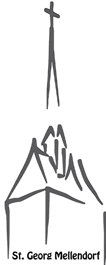
St. Georg Mellendorf