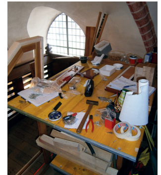
Für vier Wochen war der Werkstattisch neben der Orgel aufgebaut.