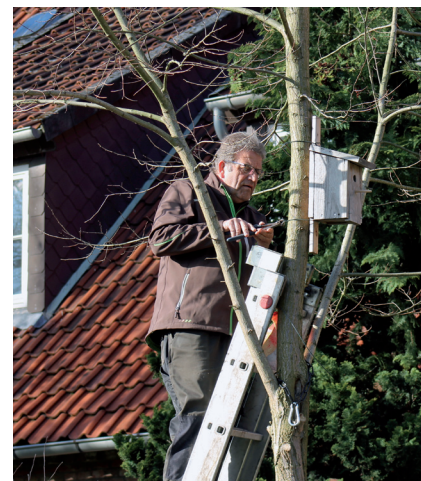
Die Nistkästen, die beim Mitarbeiterfest gebaut wurden, haben ihre Plätze an Bäumen rund um das Pfarrhaus in Brelingen gefunden.