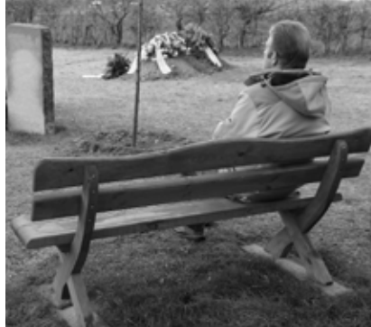
Bänke laden zum Verweilen ein

Immer häufiger ist in Einladungsschreiben zu besonderen Geburtstagen oder Ehejubiläen zu lesen, dass auf Geschenke verzichtet wird und an deren Stelle um eine Geldspende für eine karitative oder soziale Einrichtung oder Hilfsorganisation gebeten wird. Dieser Zusatz, verbunden mit dem Verzicht auf Blumen- oder Kranzspenden, findet sich oft auch unter Traueranzeigen. Auch den Kirchengemeinden sind derartige Spenden willkommen. Sie können Spendenbescheinigungen ausstellen und das Geld für aktuelle Projekte einsetzen. Natürlich kann auch der Spender bestimmen, wofür sein Geld verwendet wer-